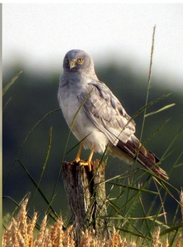
Busard St martin mâle