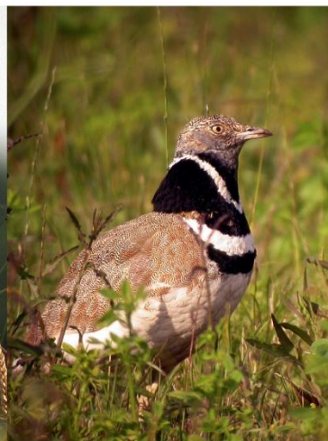
Outarde canepetière mâle