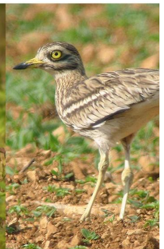
Cecidnème criard