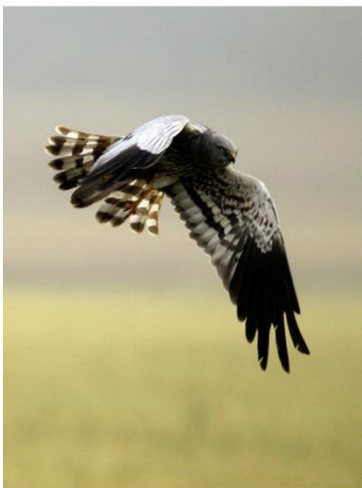
Busard cendré mâle